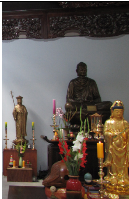
Chữ khắc trên mõ: Bảo Quang Ni Tự